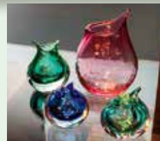
富山ガラス工房の作品です。足を運んでください。