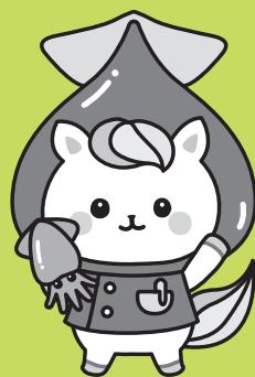
富山県かんどちゃん(ホテルイカver.)