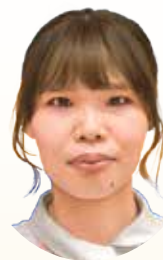
富山県立中央病院 中央病棟A 2階南・GCU 看護師

をする機会がありました。研修後にはNICU・GCU・外来の3部署で退院に向けて切れ目のないケアや指導を行うために統一したパスと指導用の資料を作成しました。今後はパスを使用しながら医療的ケア児とご家族が安心して地域で生活できるよう支援を継続していきたいです。