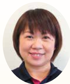
南砺市訪問看護ステーション 緩和ケア認定看護師

宗教家の関わりは医療者とは違う視点であり、最期の一瞬までその人の「存在価値」「生きる力」を高める支援に繋がると考えます。今後も宗教家との連携を通し、スピリチュアルティの根源である人としての尊厳やQOL・QODを高める活動を継続していきたいと思ひます。