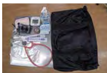
退院前・後訪問時の物品

をする機会がありました。研修後にはNICU・GCU・外来の3部署で退院に向けて切れ目のないケアや指導を行うために統一したパスと指導用の資料を作成しました。今後はパスを使用しながら医療的ケア児とご家族が安心して地域で生活できるよう支援を継続していきたいです。