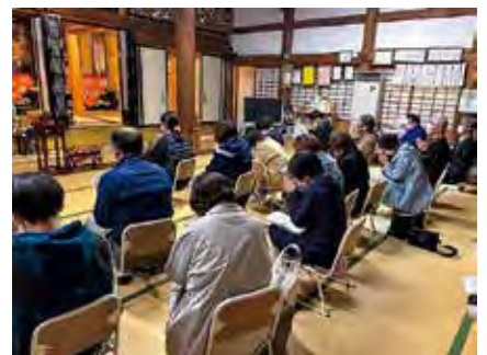
信仰文化が根付く南砺市井波