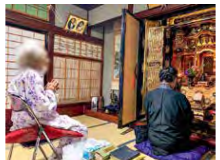
自宅で先祖の供養