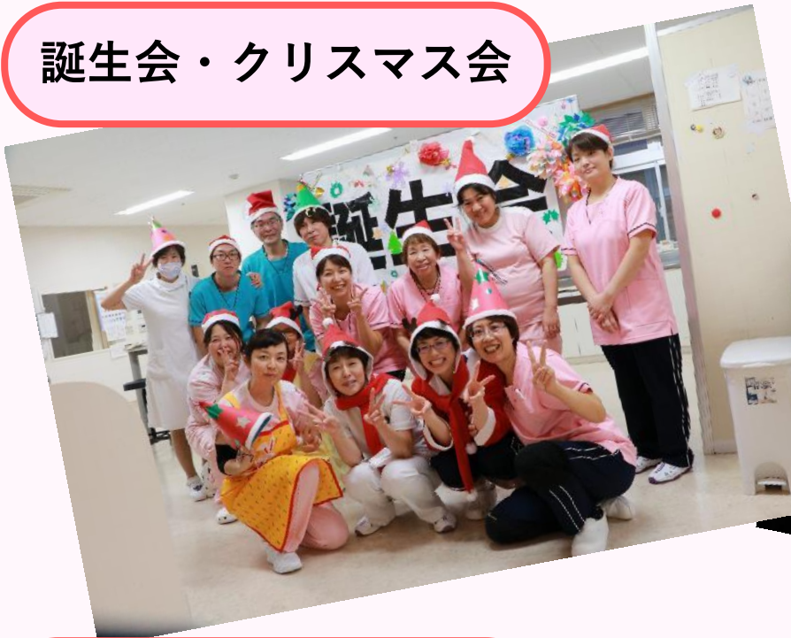
誕生会・クリスマス会