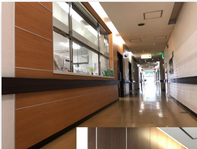
2階病棟 ナースセンター前