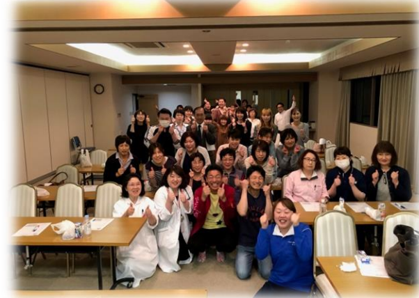
院内多目的ホールにて院内研修