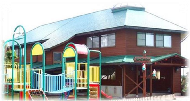
木の子ハウス (託児施設)