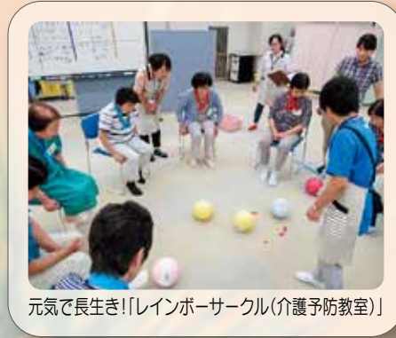
元気で長生き!「レインボーサークル(介護予防教室)」