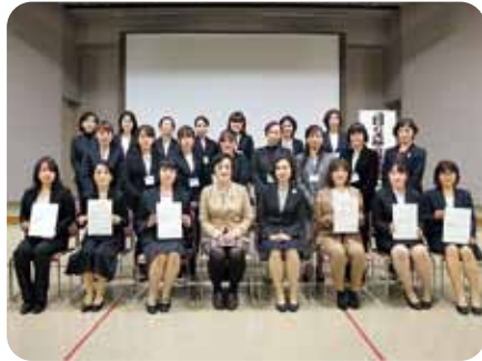
修了証書が授与されました