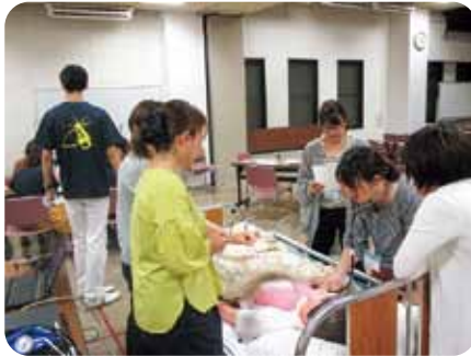
看護技術の練習をしました