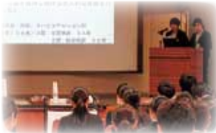
病院紹介プレゼンテーション