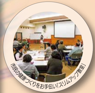
市民の健康づくりをお手伝い「スリムアップ教室」