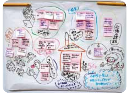
ワールドカフェで意見交換をしました