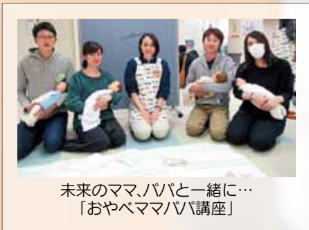
未来のママ、パパと一緒に… 「おやべママパパ講座」