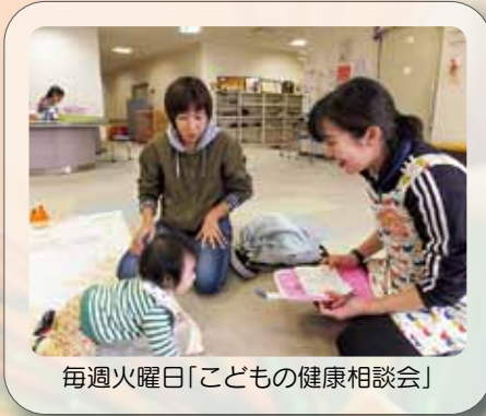
毎週火曜日「こどもの健康相談会」