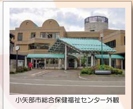
小矢部市総合保健福祉センター外観