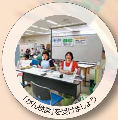
「かん検診」を受けましょう