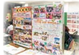
病院紹介掲示コーナー