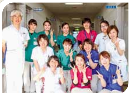
多職種が連携しています！