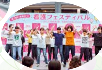
看護学生によるダンス