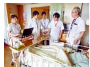
認知症ラウンドの様子