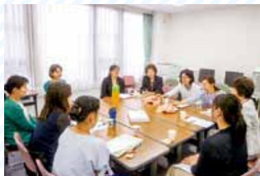
再就業に関する不安などを皆で共有しました(定期研修)

ナースセンターでは再就業希望で看護技術に不安がある方に希望する病院等で最近の看護についての知識や技術を習得するお手伝いを行っています。お気軽に相談にお越しください。