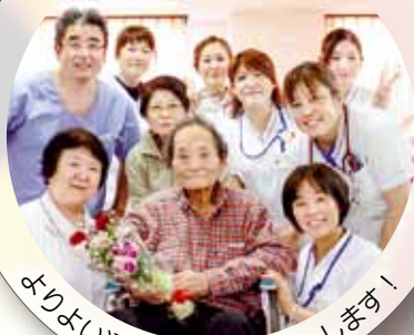
よりよい透析生活をサポートします！