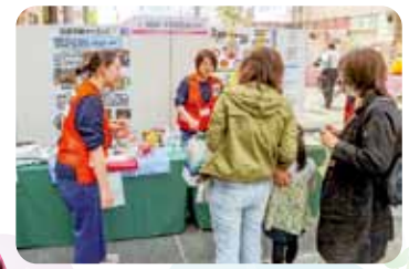
災害支援ナースのブース展示