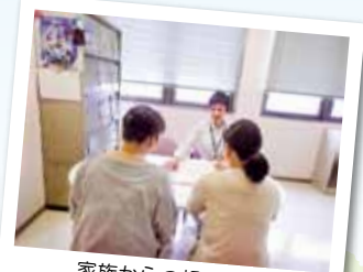
家族からの相談面談