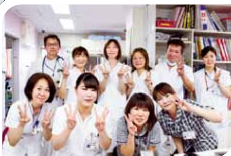
一般・地域包括病棟スタッフです！