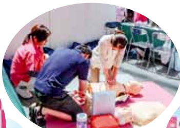
救急看護認定看護師による 蘇生法の体験