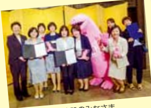
受賞施設のみなさま

と き 5月23日(水) と ころ ザ・ストリングス表参道 (受賞施設) ・黒部市民病院 ・富山赤十字病院 ・富山県済生会富山病院 ・医療法人社団和敬会 谷野呉山病院