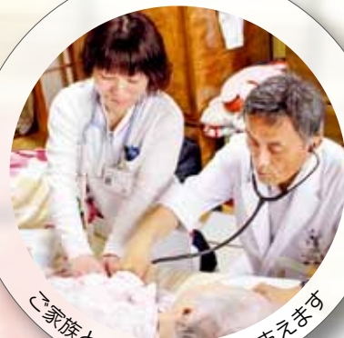
ご家族とともに在宅療養を支えます