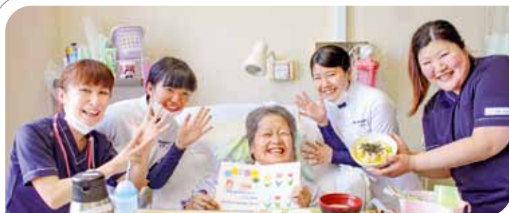
明るく穏やかな療養を支えます