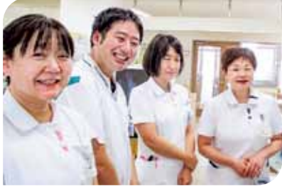
今日も笑顔の医療病棟スタッフ