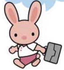
訪問看護ネットワークセンターマスコット