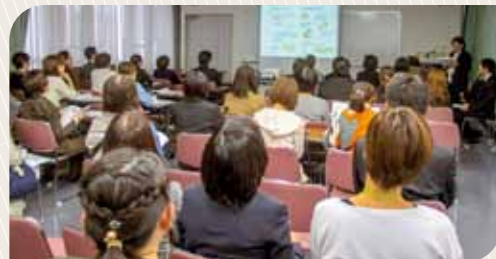
病院紹介プレゼンテーション