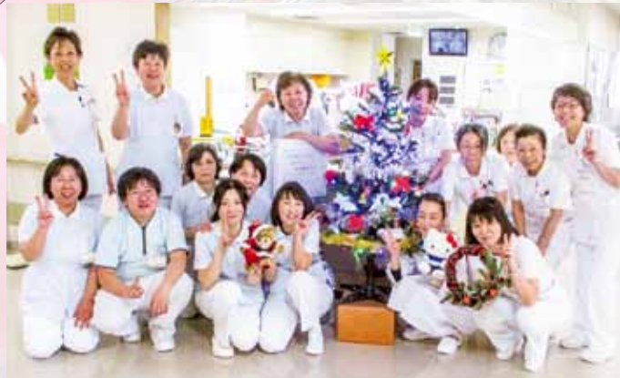
看護・介護力を合わせてがんばります