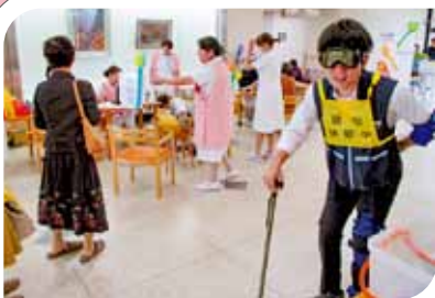
健康まつり体験コーナー