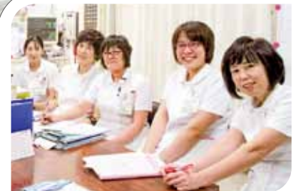
和やかな笑顔でカンファレンス中