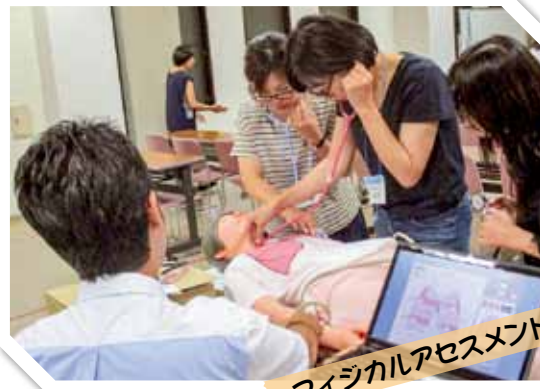
フィジカルアセスメント

集合研修では、認定看護師による最新の情報が含まれた講義内容であり、学んだことをすぐに現場で実践することができました。研修を通して、様々な年代や職場の方々と知り合うことができ、交流が図れた。