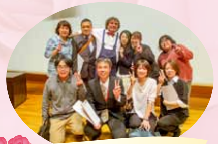
認知症看護認定看護師さんにも 協力して頂きました