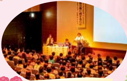
先生に魅了される会場の様子

講演の一部を紹介します。ユマニチュードとは、新しい認知症ケアの手法であり奇跡ではなく、技術です。正面から見つめあうことで、愛と信頼のホルモン、オキシトシンが分泌されます。視線を合わせることで、言葉よりも早く「私は、あなたの味方」というポジティブな思いを伝えることができます。また、寝たきりにさせないことが大切で、40秒間立つことで清拭やシャワーができ、1日20分間立てれば寝たきりになりません。自分の足で立つことは人としての尊厳を自覚することにつながります。ユマニチュードは人と人との前向きな絆です。