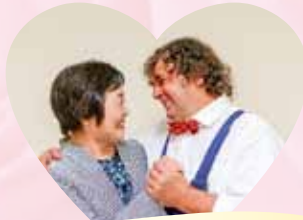
見つめ合う時間の長さに ビックリ！